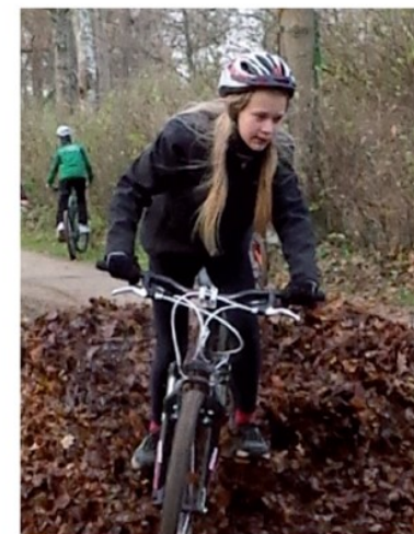
Kräfte messen in der Natur – mit den schuleigenen Mountainbikes macht Bewegung Spaß!