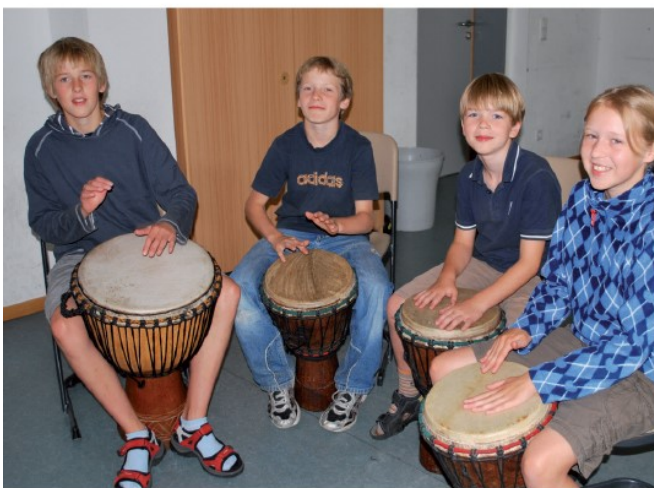
Rhythmusgefühl, Handmotorik und nicht zuletzt eine Menge Spaß: Durch Spenden angeschaffte Trommeln bereichern den Musikunterricht und ermöglichen ein Trommel-Projekt.

WIR ELTERN KÖNNEN neben dem Versuch politischer Einflussnahme Abhilfe schaffen, indem wir durch eigenes Engagement die Arbeit der Schule unterstützen.