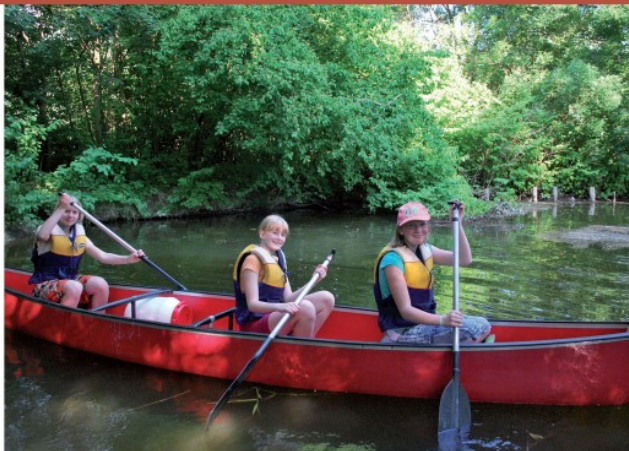
Spenden machen es möglich: Abschalten vom Schulalltag – hier sind Gleichgewicht, Kraft und eine große Portion Teamgeist gefragt!

DER FÖRDERVEREIN DER AVS ist ein Zusammenschluss engagierter Eltern und Lehrer, die durch ideelle und finanzielle Unterstützung die Lernangebote für alle Kinder erweitern.